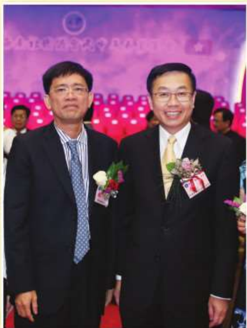
中聯辦副主任何靖與會長林青合影