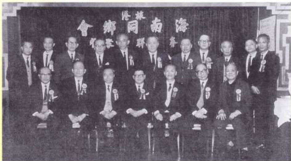
1969 年春節聯歡聚餐席上全體籌備委員會委員暨工作人員合影（錄自 1969 年創會《特刊》）