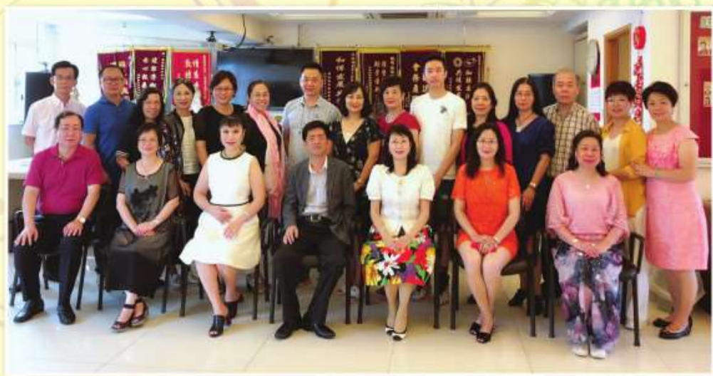
香港海南省同鄉協會前來本會拜訪