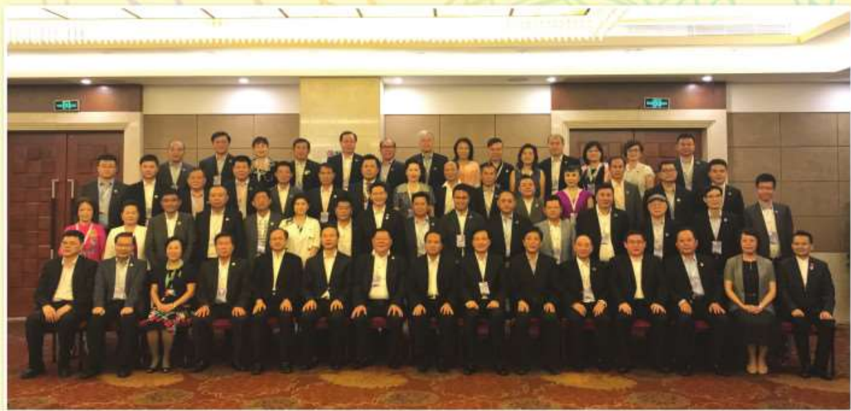
海南省委書記劉賜貴(前排中)等領導與林青會長(前二排左五)、李桂英常務副會長(前三排右四)等合影留念