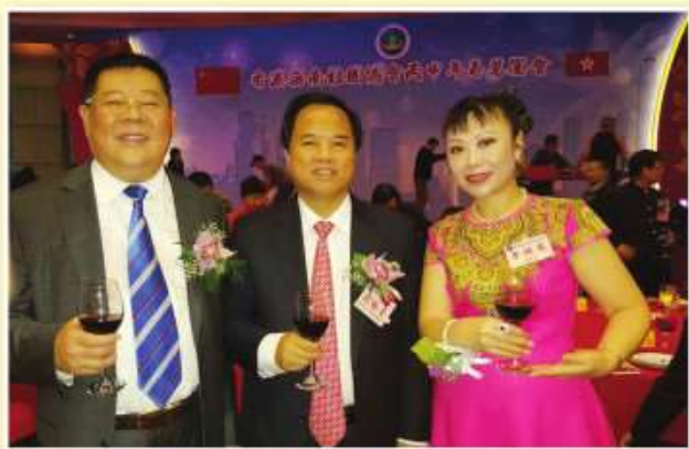
海南省委書記劉賜貴(中)與永遠榮譽會長張泰超(左)、常務副會長李桂英(右)舉杯合影