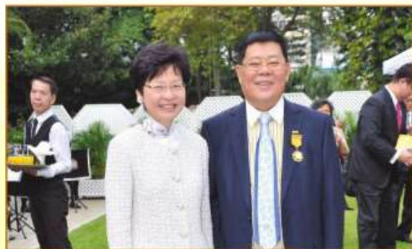
2015年時任政務司司長林鄭月娥祝賀永遠榮譽會長張泰超授勳