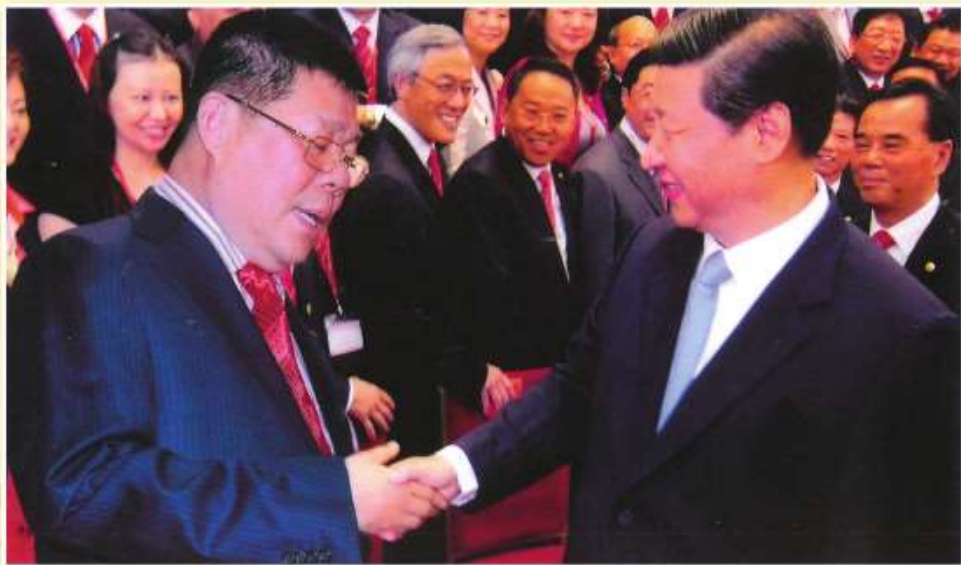
國家主席習近平與永遠榮譽會長張泰超在人民大會堂親切握手

本會成立多年以來，一直得到中央、香港特區政府、中聯辦、海南省委和省政府等重要領導支持和關懷，在多項重大活動中與本會一眾首長親切交流、合影。