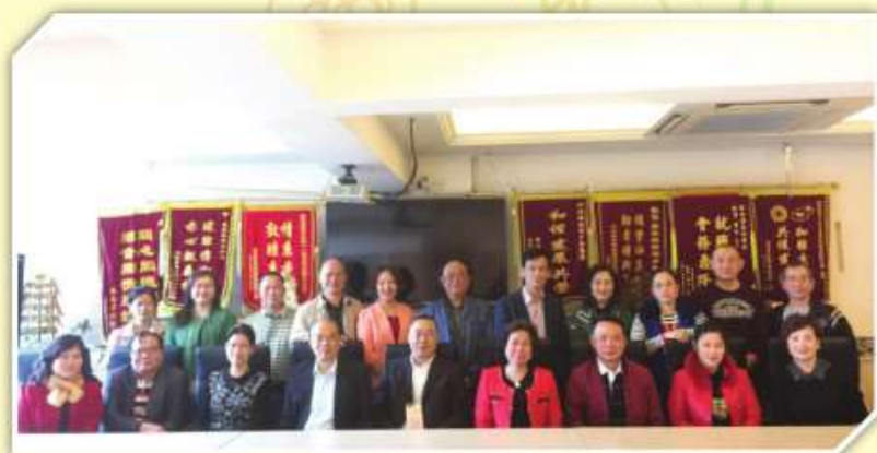
海南省瓊劇院代表團前來本會拜訪