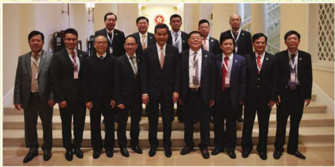
2016年1月18日，時任特首梁振英(前排中)與會長林青(前排右一)、永遠榮譽會長張泰超(前排右四)等海南社團首長在禮賓府合照留念