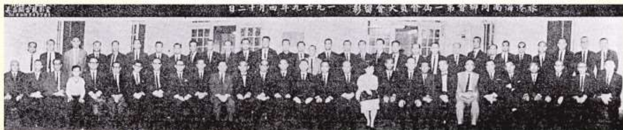
旅港海南同鄉會第一屆會員大會合影（錄自 1969 年創會《特刊》）