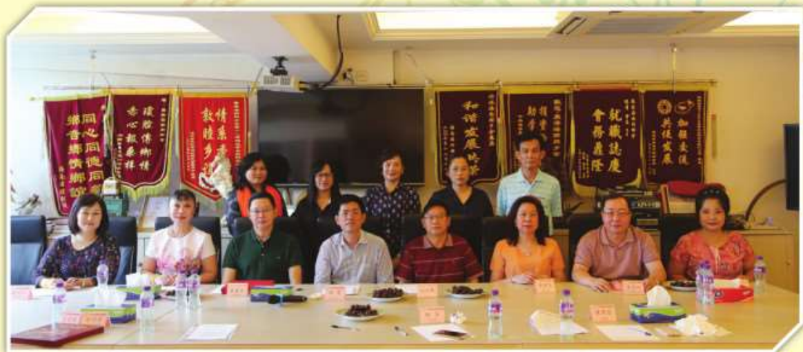
海口市政協一行領導拜訪本會