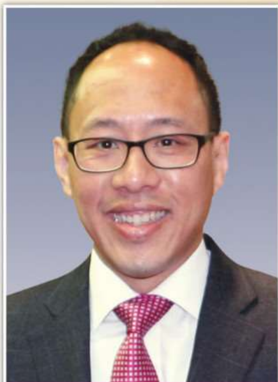
李文俊 SBS, JP